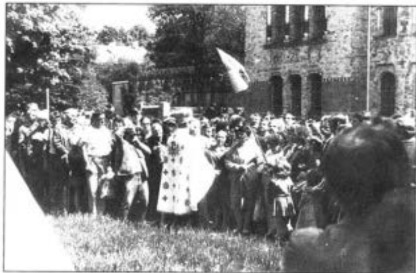
Панахида по С.Петлюрі. Полтава, травень 1989 р.