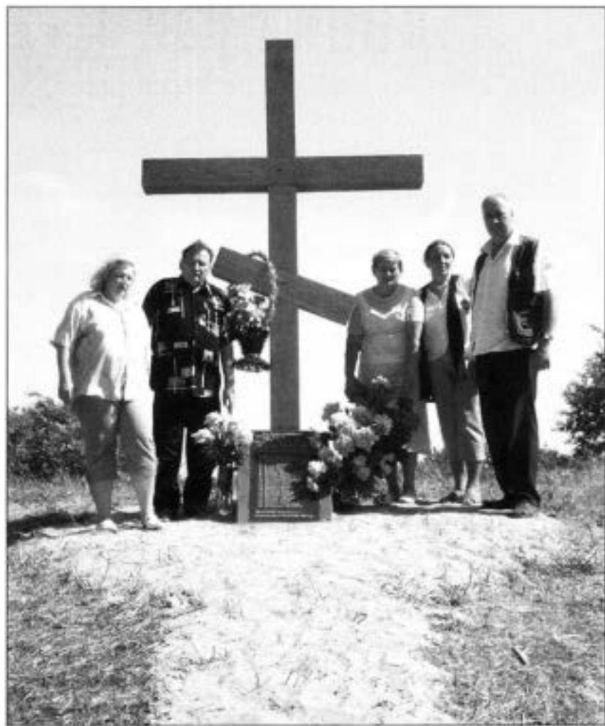
Встановлення Хреста у пам'ять закатованих чекістами селян у с. Мушівка Хорольського району, 2007 р.