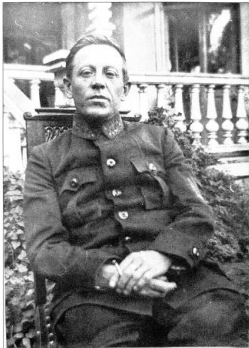
Голова Директорії УНР, Головний отаман армії УНР С. Петлюра, м. Кам'янець-Подільський, серпень 1919 р.

36000, м. Полтава, пров. Піонерський, 4 Полтавське обласне об'єднання ВУТ «Просвіта» ім. Т.Г.Шевченка. Тел.: 8 (05322) 7-31-45, 8 (0532) 56-41-45.