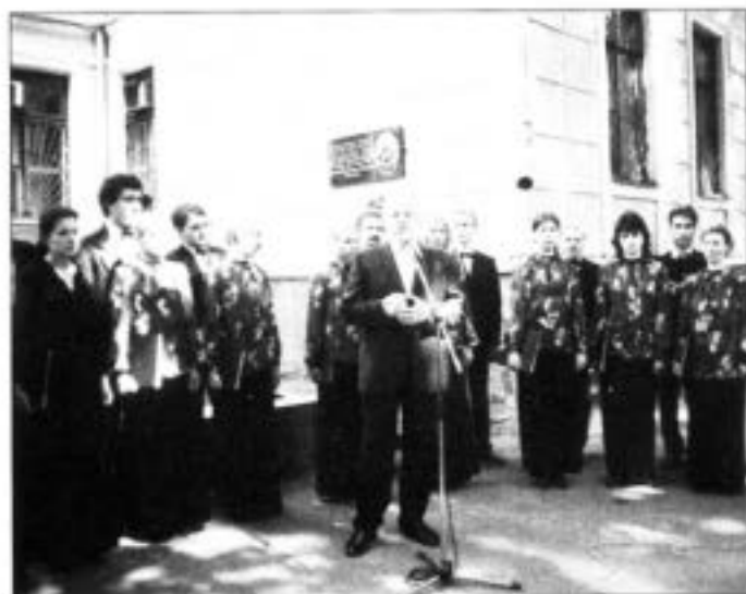
Відкриття меморіальної дошки Симону Петлюрі на приміщенні колишньої Полтавської духовної семінарії (нині навчальний корпус Полтавської державної аграрної академії). Виступають: голова Полтавського обласного ВУТ «Просвіта» ім. Т.Шевченка, народний депутат України М.Г.Кульчицький (фото вгорі), голова Полтавської обласної державної адміністрації В.М.Асадчев. Серпень 2006 р.