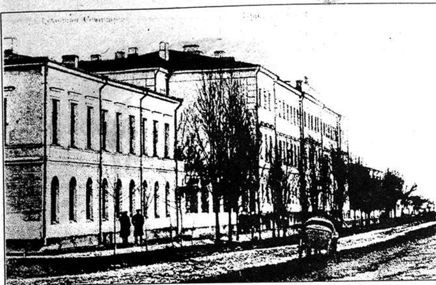
Приміщення Полтавської духовної семінарії, де навчався Симон Петлюра (1895 — 1902). Фото початку ХХ ст.

© Публікація Володимира Коротєнка, Тєрасє Пустовіта.