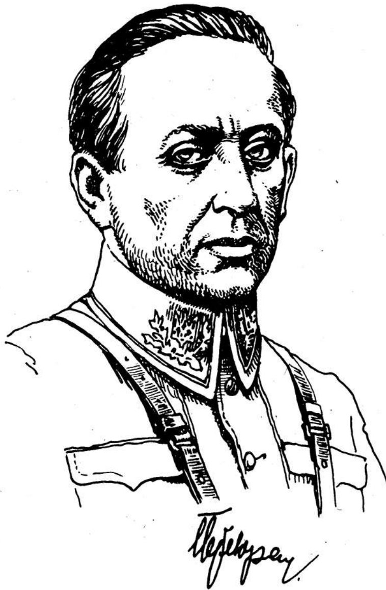
Симон Васильович Петлюра (1879 — 1926 рр)

Багатьох прагматиків цікавить насамперед таке запитання: «Якою була б економічна система Української Народної Республіки (УНР) при умові утвердження її на політичній карті світу як самостійної держави?». Іншими словами, суть цього запитання зводиться до з'ясування рівня ефективності тієї економічної моделі, яку відстоювали лідери УНР, можливого порівняння її з існуючими сьогодні економічними моделями розвитку європейських країн. Скажемо прямо: можливість такого аналізу з'явилася зовсім недавно, адже навіть професійні історики не мали у своєму розпорядженні необхідних першоджерел, праць істориків 20 — 30-х років, новітніх досліджень суспільствознавців західних наукових інституцій тощо. Виключне значення для аналізу економічних поглядів діячів УНР має опублікований у 1992 році харківським видавництвом «Лівий берег» збірник статей, листів і документів самого С. Петлюри, а також праця його соратника по боротьбі Володимира Винниченка «Заповіт борцям за визволення» (К.: «Криниця», 1991). На останню публікацію ми звертаємо особливу увагу тому, що В. Винниченко виклав економічну програму Української соціал-демократичної робітничої партії більш детально, ніж С. Петлюра. При цьому заува-