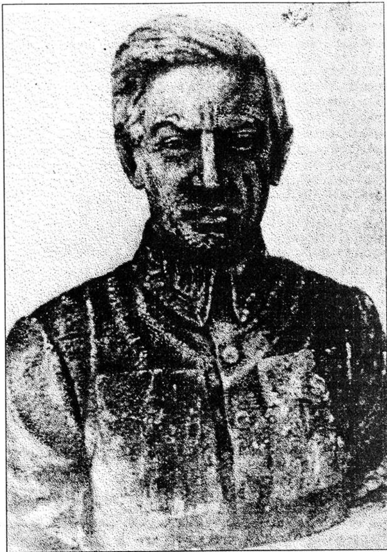
М. Парашук. Скульптурний портрет С. Петлюри. 1936.

Уже під час своєї першої поїздки до Софії (липень — серпень 1973 р.) я поставив перед собою завдання оглянути, по можливості, всі його праці, які там були. Університет, Національний Банк, Судова Палата, Міністерство Оборони, Військова Академія — усі ці монументальні установи містять в себе елементи скульптурно-декоративної творчості Парашука. Майже всі портрети (нараховувалося їх